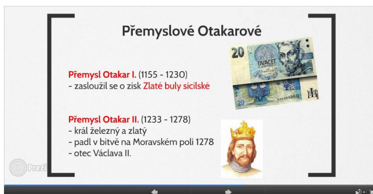
Dílčí snímek prezentace Přemyslovci (3. bod na horní straně časové osy v úvodním snímku prezentace)