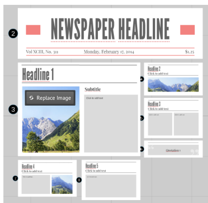
Šablona Newspaper – uspořádejte prezentaci jako novinový článek

Mimo univerzálně aplikovatelné motivy připravilo Prezi i šablony, které jsou primárně určené pro společenskovední témata. Příkladem doporučených šablon pro oblast Základů společenských věd jsou Social Network , Newspaper (téma média, sociální síť, internet), Teamwork (spolupráce, solidarita, komunikace), Center Stage (dramaturgická sociologie), Family Tree , Timeline (struktura společnosti, uspořádání firmy, rodokmen). I když se jedná o detailně propracovaný vzor, můžeme ho upravit a přidávat do něj vlastní prvky. Šetřeme proto čas a nevymýšlejme již vymyšlené.