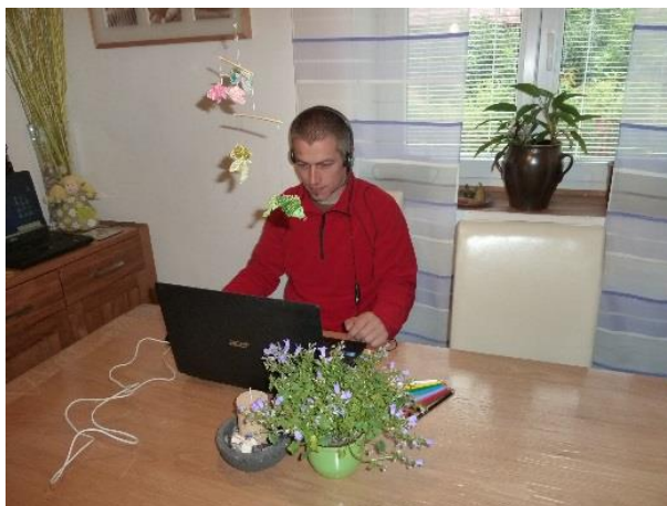
Táta Vašek upravuje zvukové nahrávky

4. Táta zvuk v počítači sestříhal a emailem odeslal.