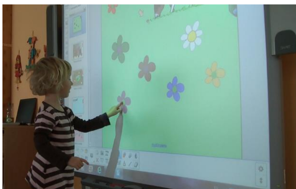
Ověřování v MŠ Sluníčko Hradec Králové

6. Výukový materiál byl ověřen u tabule s dětmi.